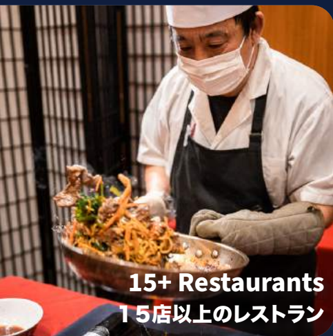
15+ Restaurants 15店以上のレストラン

18 FSSは、米空軍の福利厚生プログラムに関連するさまざまなマーケティング経路と高水準のサービスを通じて、貴社の米軍基地市場への参入をお手伝いいたします。