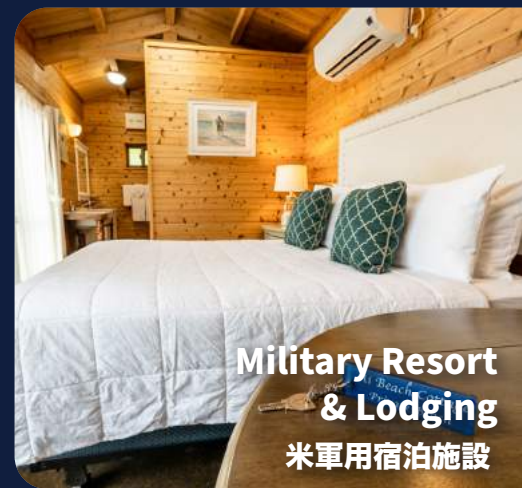
Military Resort & Lodging 米軍用宿泊施設