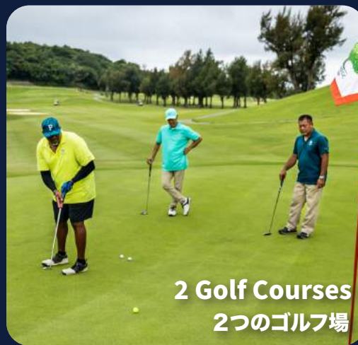
2 Golf Courses 2つのゴルフ場