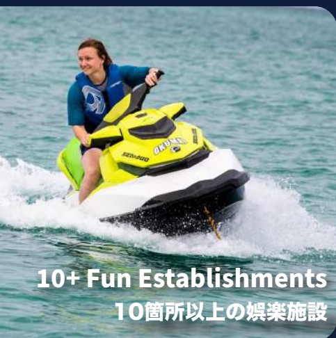
10+ Fun Establishments 10箇所以上の娯楽施設