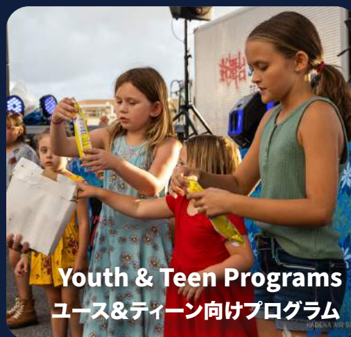
Youth & Teen Programs ユース&ティーン向けプログラム